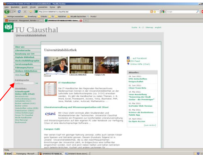
Homepage der UB/Startseite

Die elektronischen Bücher sind zu einem großen Teil bereits im Online-Katalog der UB (OPAC) verzeichnet. Der OPAC kann direkt von der Homepage www.bibliothek.tu-clausthal.de aus durchsucht werden, indem in das Feld „Katalogsuche“ in der linken Spalte ein Stichwort eingegeben wird.